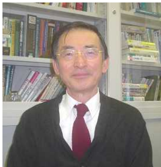
大阪工業大学 工学部 ロボット工学科 赤澤研究室にて 2011年2月24日撮影

Q : サイミス研究会には実際にサイミスを使っておられる福祉施設の職員が参加されています。現場の声はどのようなものですか?